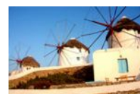
Après Magic Fix !

Les yeux rouges, vidéos tremblantes et les images floues ne seront plus qu'un mauvais souvenir !