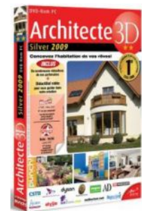
Architecte 3D Silver