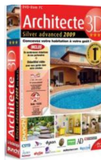
Architecte 3D Silver Advanced