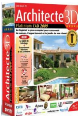
Architecte 3D Platinum CAD

En France, 4 versions de Punch ! Architecte 3D sont disponibles :