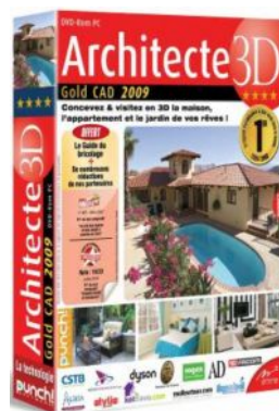
Architecte 3D Gold CAD